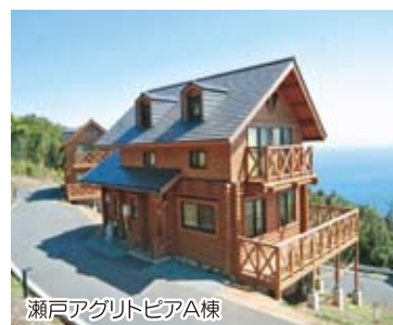
瀬戸アグリトピアA棟