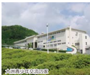
大洲青少年交流の家